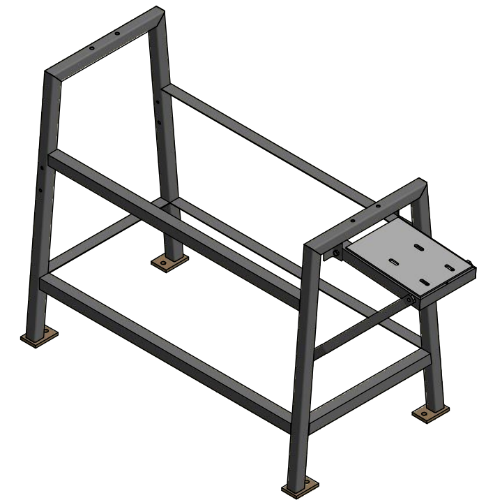
VISTA ISOMETRICA Escala: 1 : 20